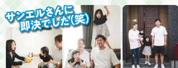
サンエルさんに即決でした(笑) 本当に安心してお願いできるというか、ほぼおまかせします!というぐらいの信頼感がありました。そして何より「楽しかった!」この一言に尽きます。