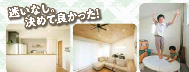
迷いなし。決めて良かった! 営業担当の方に電話をしてから、数分で工務の方が駆けつけてくださったときは、担当者が違うにも関わらず見事な連携と対応のスピーディさには感心しました。