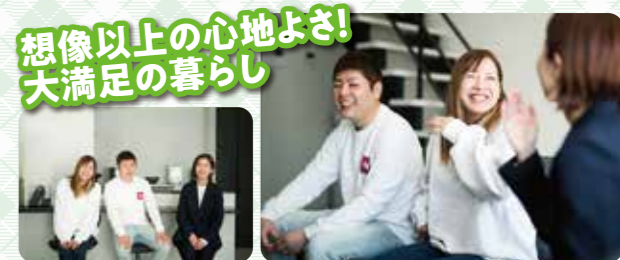
想像以上の心地よさ! 大満足の暮らし あと2社くらい見に行く予定でしたが、帰りの車の中で「もうここだね!」って、サンエルさんに即決しました。