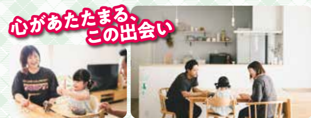
心があたたまるとこの出会い 強引な勧誘をされることもなく、ライフプランを考えてくださる真摯な姿勢に「ぜひお願いしよう」とふたりの意見が合いました。