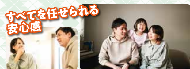
すべてを任せられる安心感 担当者の方がとても好印象でした。意見を押し付けてくることはなく、わたしたちの希望をじっくり聞いてくれる姿勢からお任せしたいと思いました。